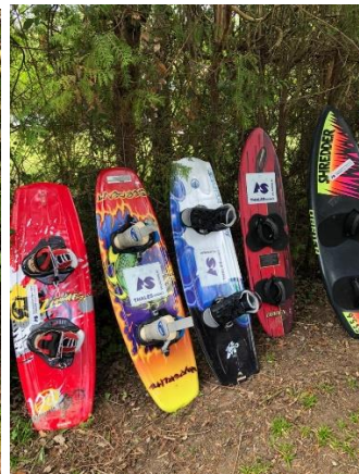
Bi et monos adultes