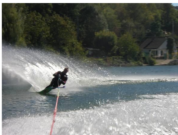
Monoski et slalom