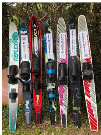
Bi et monos adultes