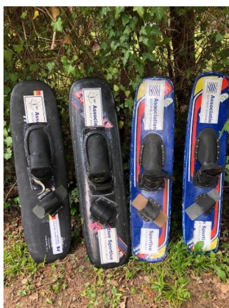
skis de figures