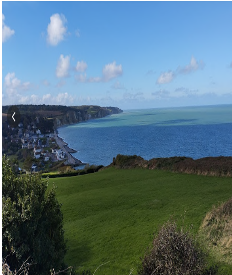
golf de Dieppe